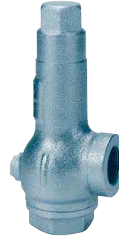
レバーなし密閉形